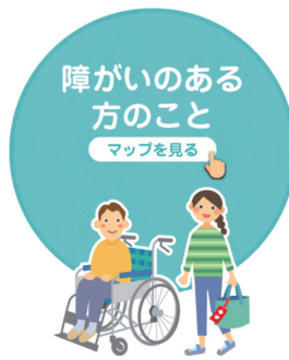
障がいのある方のこと