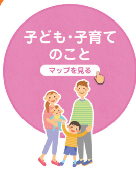
子ども・子育てのこと